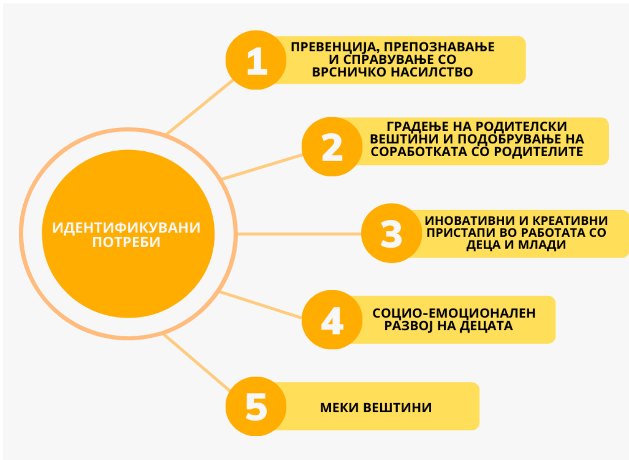
Графикон 2: Идентификувани потреби за обуки за локалните власти и воспитно-образовниот кадар институциите